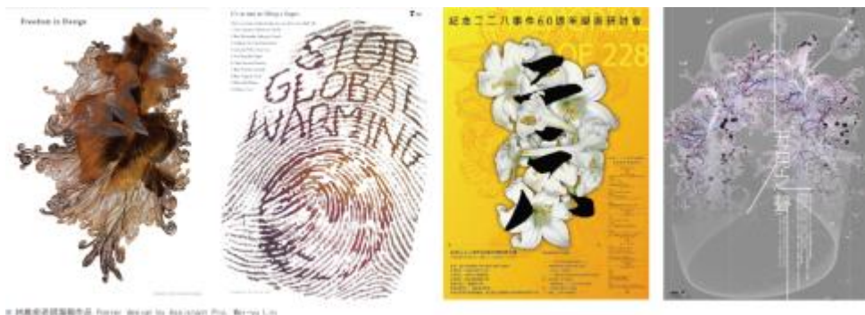
© 林義和老師設計作品 Poster design by Assistant Prof. Kuo-yao Liu

本系大學部，除肩負提升視覺設計人力的素質外， 以藝術為本位，文化為內涵，培育藝術與科技素養兼備人才。