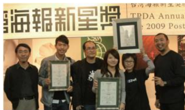
海報設計新星獎獲獎同學 Awarded students of Taiwan Poster 2009