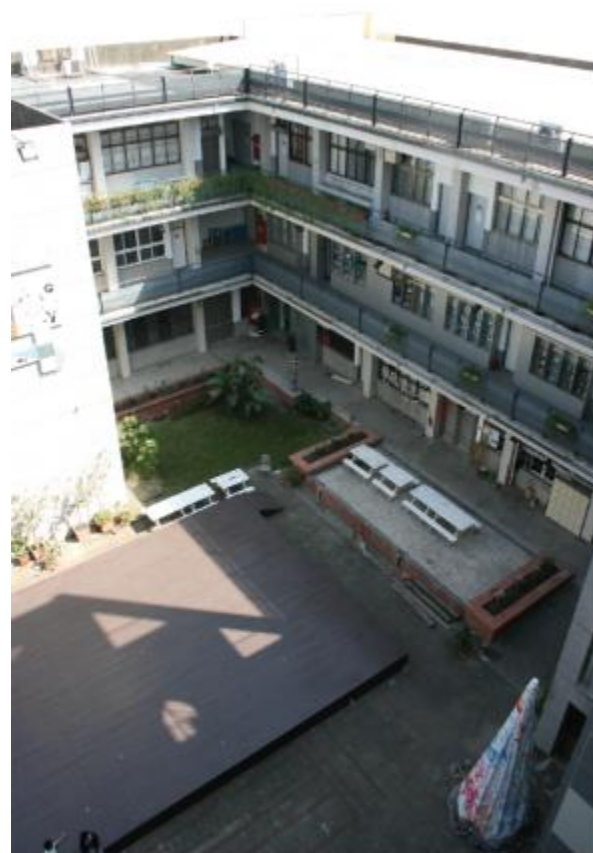
高雄師範大學視覺設計系景觀 The Department of Visual Design, National Kaohsiung Normal University