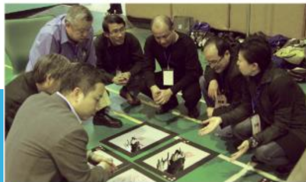
海報設計新星獎評審過程 The assessment process of Taiwan Poster 2009