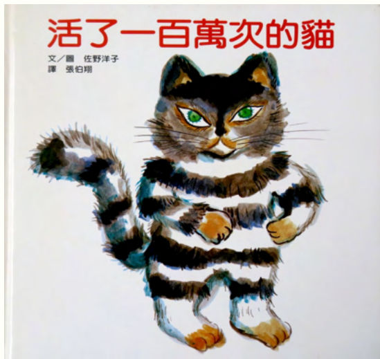
步步出版《活了100萬次的貓》書封

我們總和知己朋友互遞真心，說著彼此上輩子肯定認識，早就注定好相遇；或者語帶幸福感的說，我對你這般好，是上輩子欠你的；我們也可能含情脈脈的對著愛人說：「下輩子還要當夫妻」，相親相愛不離去；或是疼愛孩子，說女兒是爸爸上輩子的情人。