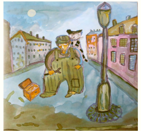
步步出版《活了100萬次的貓》內頁

當貓寶貝長大離去後，白貓也漸漸成了老貓，最後死在貓的懷裡。這一次，貓放聲大哭，就像是從前的主人們那樣，不捨著愛貓的死去，貓哭過一天又一天，錐心之痛難以消去，就這樣，貓安安靜靜的，在一百萬年後，終於真正的「死去」，真正有「活過」的感覺。