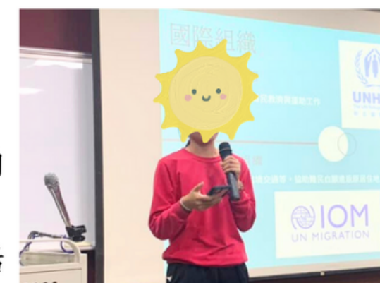
▲難民議題上台報告

在高二時期的「全球離散與流變」報告活動中，我除了擔任上台報告者的職位之外，在一次次分組討論時，同儕間難免會有意見不同的時候。當下，我就會選擇先聆聽他人的想法，再適時提出自己的看法，取得共識後，最後由我完成上台報告。我認為這門課帶給我最大的收穫就是敢於表達自己看法及聆聽他人意見的能力。