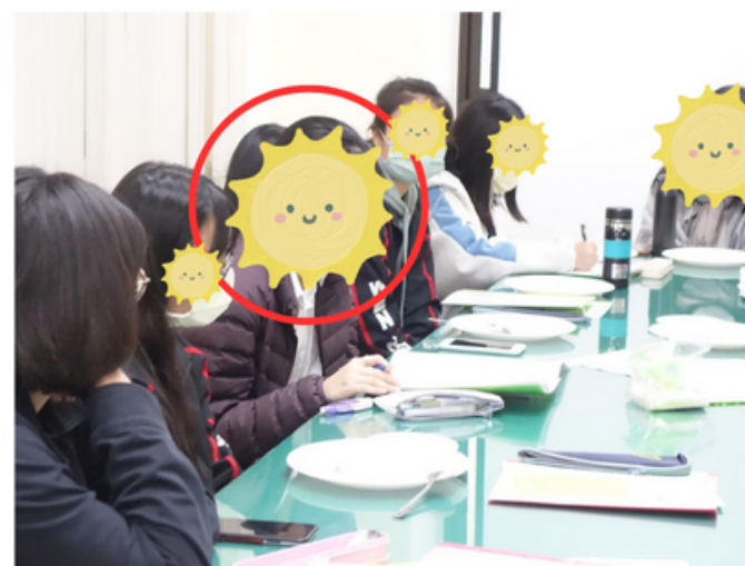
▲ 同儕輔導員定期開會

在高中時期我陸續取得了全民英檢中級、中高級聽讀的合格證書。而在剛考完學測的三月份我則報考了 多益 的聽讀測驗， 取得825分 ，礙於上傳多元表現的期限無法上傳成績，故在此附上證明。