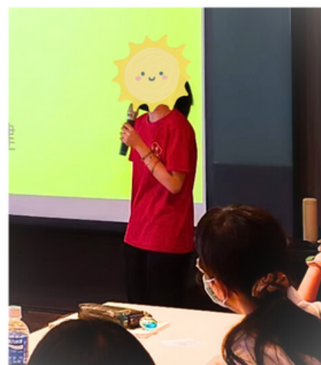
◀ 學習方法講座上台分享

在高中三年裡的經歷不勝枚舉，其中對我來說最大的鼓勵便是高三當選學年度班級模範生。在求學的道路上，不論是做事方法或是性格都會漸漸改變，這次獲獎是對我改變方向的肯定。