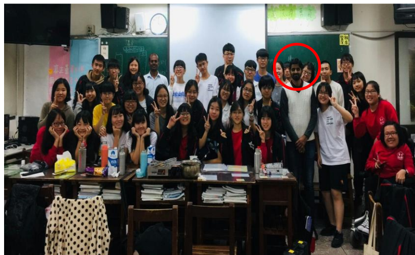
外籍生入班分享(印度、新加坡)